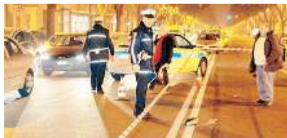
Corso Peschiera dov'è morto il piccolo Alex

L A PRIMA riunione del «tavolo di coordinamento sulla sicurezza stradale» ha partorito un giro di vite che mette nel mirino anche i pedoni. I vigili intensificheranno i controlli lungo le strade considerate più pericolose (ne sono state censite un centinaio) e multeranno chi attraversa dove è vietato o comunque lontano dalle strisce pedonali. La metà delle contravvenzioni finanzia interventi per migliorare la sicurezza stradale.