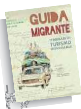
IL VOLUME La "Guida migrante"

I racconti di chi ripercorre la sua vita a ritroso