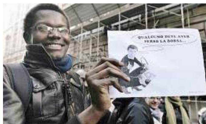
Uno dei borsisti dell'Edisu durante la manifestazione

B ORSISTI dell'Edisu ancora in piazza, ma la situazione dell'ente che eroga i servizi per gli studenti universitari fuori sede resta drammatica. La Regione fa sapere che anche nel 2012 il contributo sarà di 7 milioni, un terzo rispetto a quello di due anni fa. Il bilancio dell'ente entra in esercizio provvisorio.